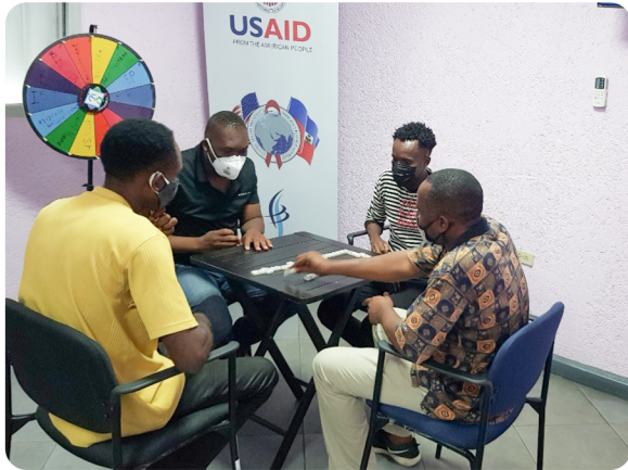
KLINIK ERITAJ SE KAY TOUT GASON